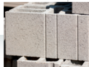
Parpaing rectifié (mise en œuvre par collage)