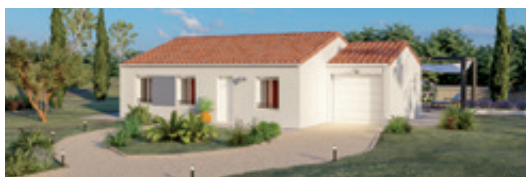
Modèle Manon (Sud) 3 chambres 76 m 2 Garage accolé en option