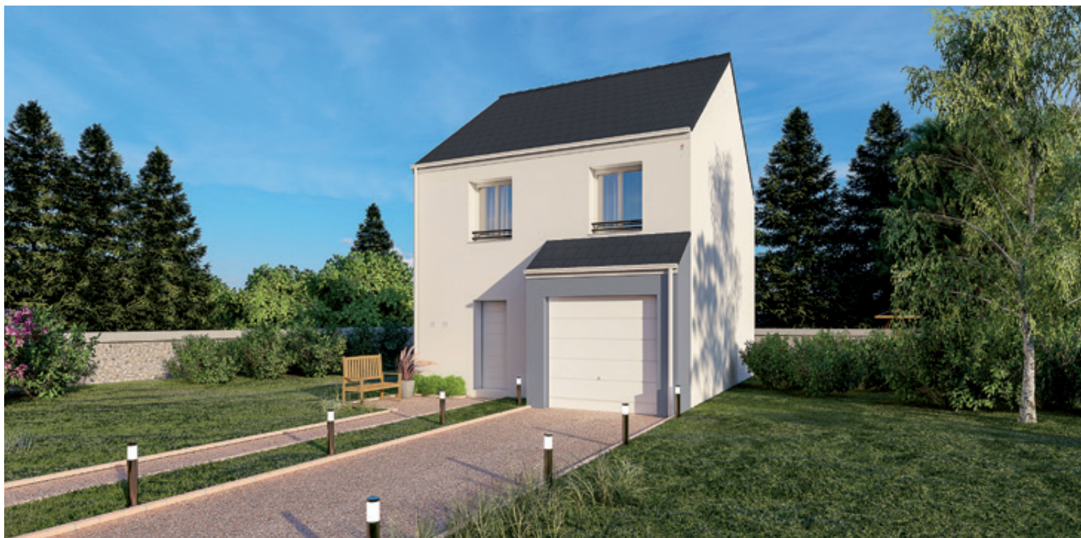
Modèle Emma De 3 à 4 chambres De 82 à 96 m 2 Selon la version : garage intégré ou accolé en option

Pour accéder à la propriété et investir dans une maison de qualité, la gamme Ma Premièremaison est idéale pour les primo-accédants qui veulent se lancer en toute sérénité dans un projet d'avenir.