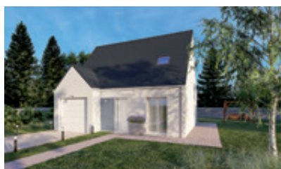
Modèle Léa De 3 à 4 chambres De 77 à 91m 2 Selon la version : garage intégré ou accolé en option