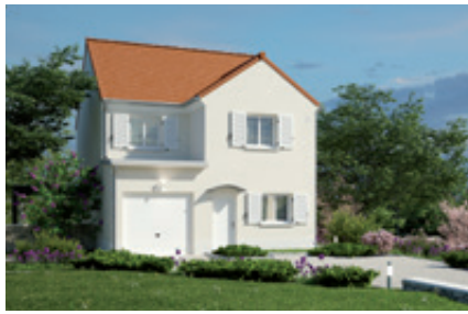
Modèle Nova 4 chambres 107 m 2 Garage intégré